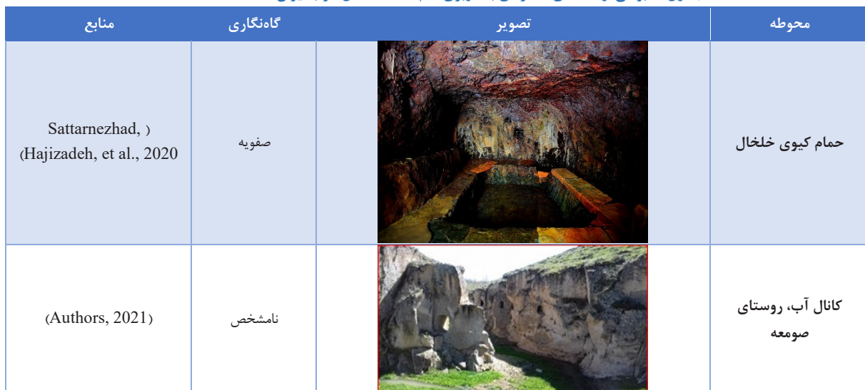
جدول ۵. برخی از فضاهای صخره‌ای با کاربری عام‌المنفعه شمال غرب ایران (Authors, 2021)

ب) تأسیسات مرتبط با سیستم آبرسانی: این قبیل از فضاها کاربری انتقال و نگهداری آب را داشته‌اند که از این نظر می‌توان آنها را به دو گونه فضاهای دستکند با کاربری آب‌انبار و دوم فضاهای دستکند با کاربری کانال‌های انتقال آب تقسیم نمود. فضاهای دستکند آب‌انبار در منطقه شمال غرب ایران عموماً در قلعه‌ها ایجاد شده و از نظر گاه‌نگاری متعلق به پیش از اسلام هستند (Kleiss, 1971). آب این فضاها به‌وسیله بارش باران پر می‌شد و کار تأمین آب ساکنان قلعه‌ها را تأمین می‌کرد. نمونه‌هایی از این آب‌انبارها در قلعه گویجه قلعه مراغه متعلق به دوره اورارتو، آب‌انبار داش قلعه میان‌دوآب متعلق به دوره اورارتو، آب‌انبار قلعه یئل سویی گرمی متعلق به دوره سلجوقی و آب‌انبار قلعه قهقهه متعلق به دوره صفوی اشاره کرد. فضاهای صخره‌ای گونه دوم عموماً کاربرد انتقال آب را براساس توپوگرافی محیط بر عهده داشته‌اند و آب را از سرچشمه به مناطق پایین‌دست هدایت می‌کردند (Razani et al., 2016). این فضاها عموماً دارای ارتفاع کمتر از ۱ متر و عرض نیم متر