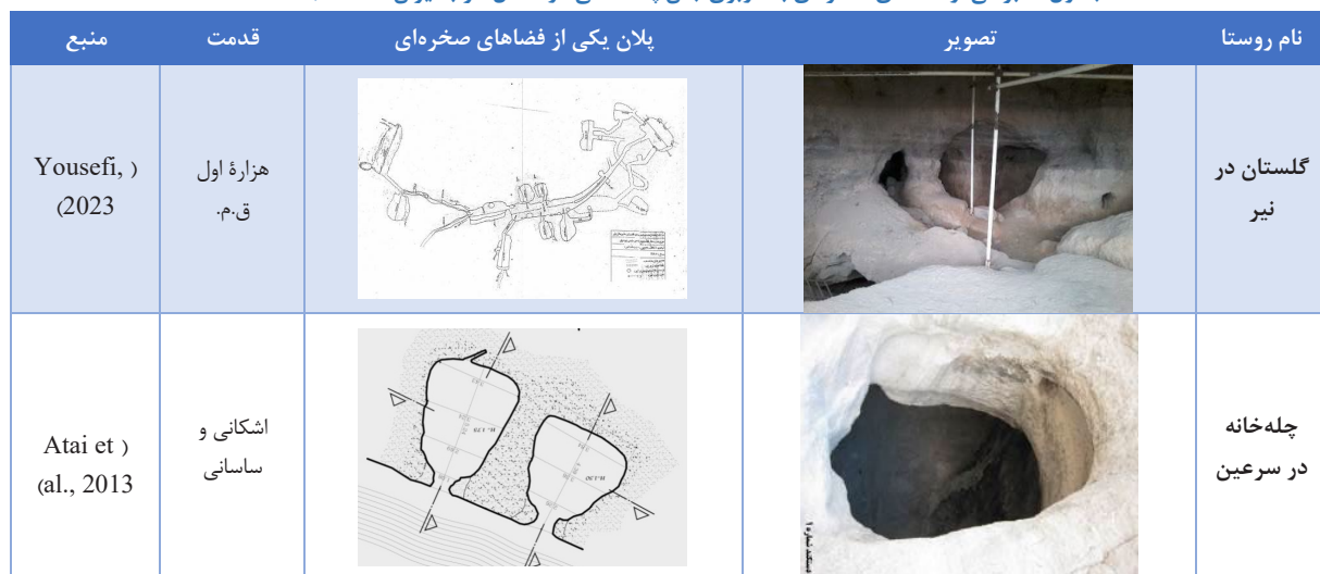
جدول ۴. برخی از فضاهای صخره‌ای با کاربری جان‌پناهایی در شمال غرب ایران (Authors, 2021)

بسیاری از این فضاها با گسترش و پیشرفت در شیوه زندگی جوامع انسانی کاربری خود را از دست داده‌اند و در حال زوال هستند. این فضاها براساس نوع کاربری به چهار گونه زیر قابل دسته‌بندی است.